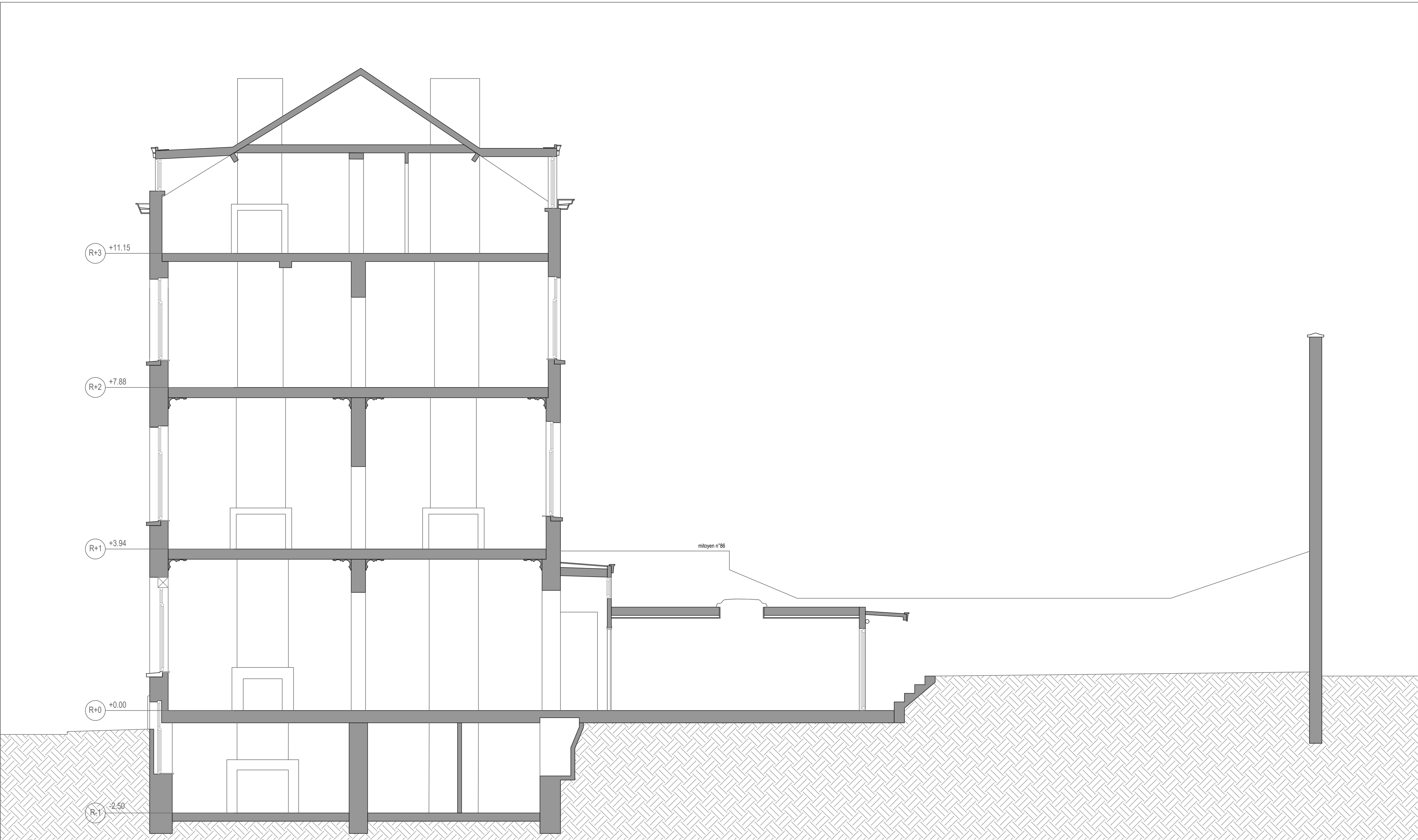
Coupe BB existante - 1/50