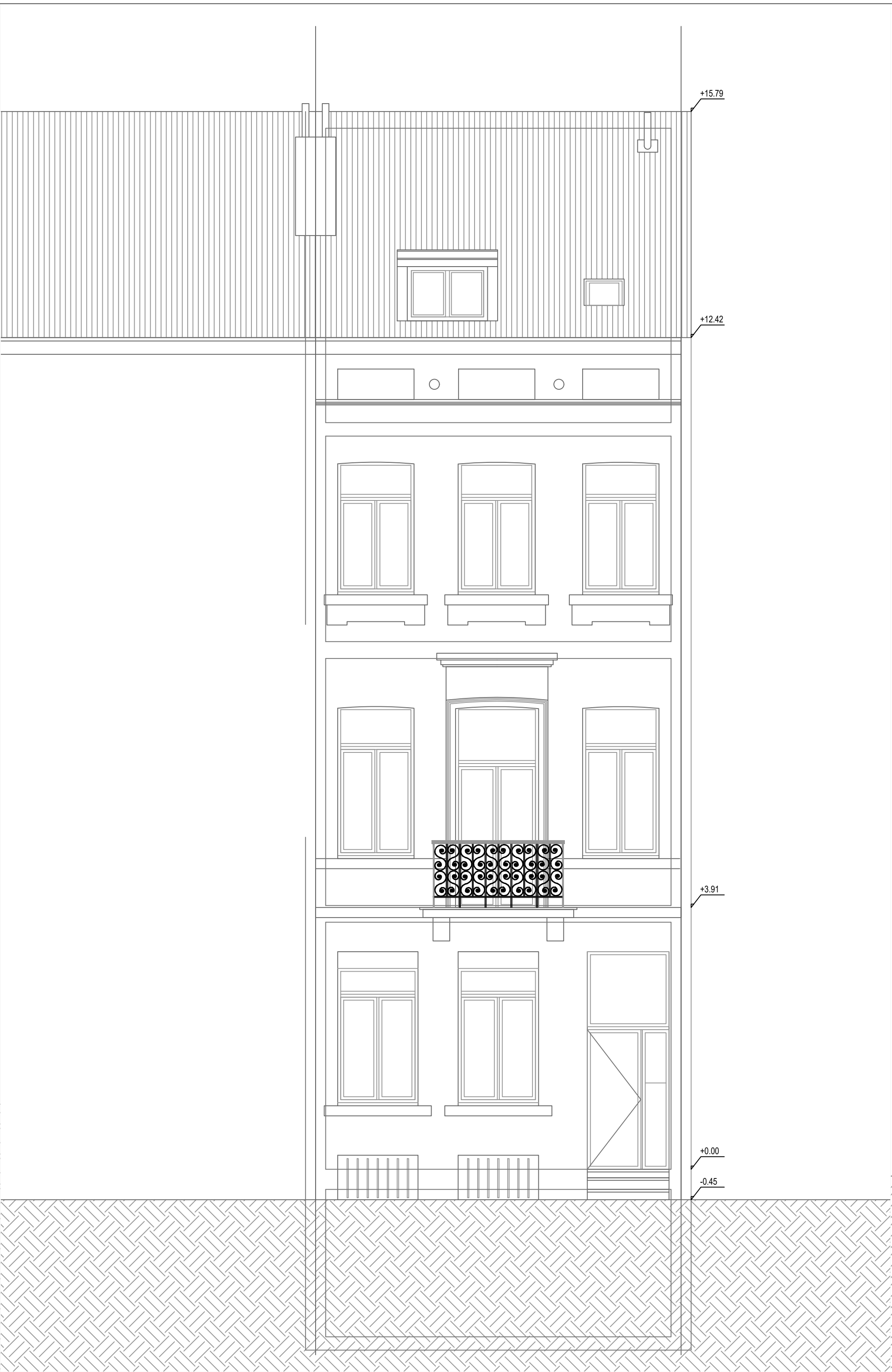
Façade avant existant - 1/50